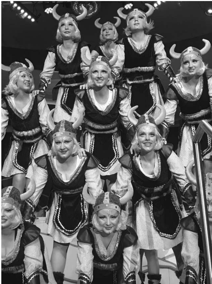
Die Gölser Möhnen boten prächtige Unterhaltung in der TV-Turnhalle – hier die Jugendshowtanzgruppe mit Ihrem Wikingertanz.