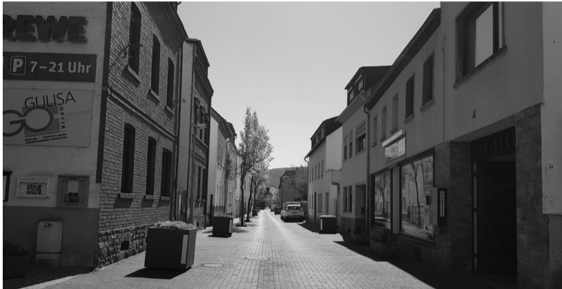
Die Gulisastraße an einem Wochentag in der Mittagszeit – die Gölser halten sich an das geltende Kontaktverbot.

Eingeschränktes Leben in Zeiten der Krise – Vernunft ist angesagt