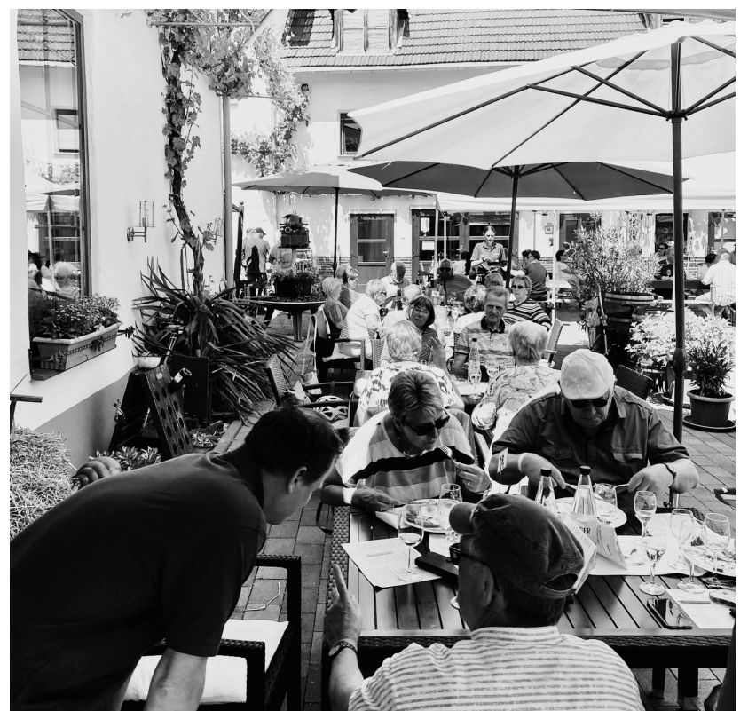
Viele Gäste sind am Pfingstwochenende der Einladung des Weinguts Lunnebach zur Jungweinprobe gefolgt. Es gab viele leckere Weine des neuen Jahrgangs zu probieren und auch für das leibliche Wohl war wie immer bestens gesorgt.