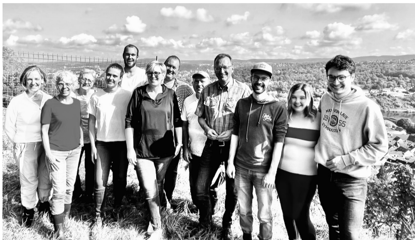
Der Hilfstrupp aus den Reihen der CDU hatte viel Freude an der Weinlese im Gölser Bienengarten.

Bei Spurzem gibt's bald ein besonderes Tröpfchen