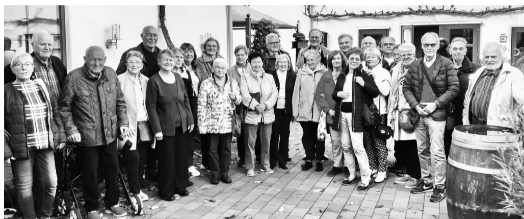
Im Weingut Lunnebach trafen sich die 75-jährigen zum deftigen Döppekoocheessen. Danach besichtigten die 26 Teilnehmer das Heimatmuseum Güls. Mit vielen interessanten Eindrücken ging es bei schönem Herbstwetter zurück zur Kaffeestunde mit selbst gebackenem Kuchen. Am Schluss waren sich alle einig, es war ein gelungenes Klassentreffen.