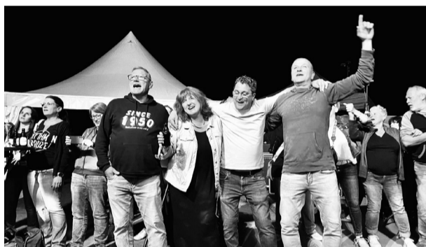
Die Zuschauer hatten sichtlich Spaß beim Konzert der Band Rhythm’n Booze aus Moselweiß.