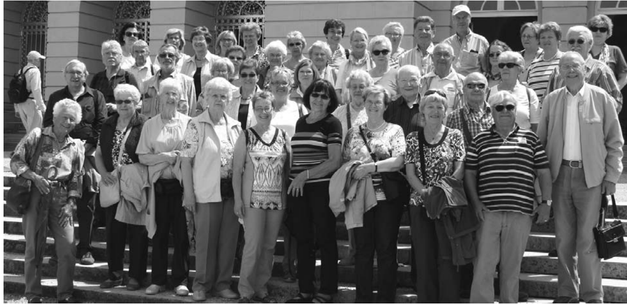
Auf den Stufen des Schlosses Herrenchiemsee stellten sich die Besucher aus Güls zu einem Erinnerungsfoto.