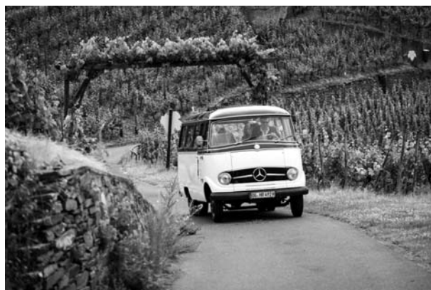
Oldtimerbus des SWR bringt die Damen zum Hühnerhof.