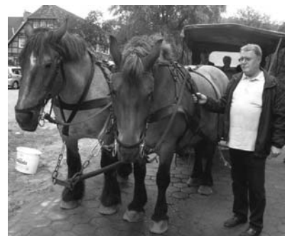
Der Pferdeflüsterer vom Kirchenchor macht dem Kutscher noch was vor.