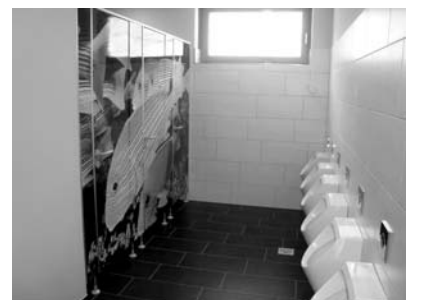
Besonderer Blickfang: Ein riesiger Fisch zielt die Türen der Jungentoilette.

erklärte der Schulleiter. Die Kinder erhalten ein Mittagessen und können neben der Lernzeit an dem breiten Angebot der Arbeitsgemeinschaften teilnehmen, die von Handarbeit, Musical, Erster Hilfe bis zur Arbeiten an den 24 funkelneuen Computern reichen, mit denen die Schule ausgestattet wurde.