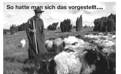
So weit man sich das vorgestellt... Soweit man mit dem Aug' kann gucken, die ganze Heide voller Schnucken.