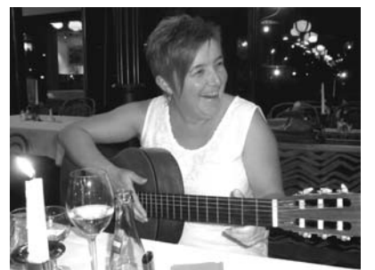
»Zwei Dinge, die sich gut vertragen, Wein trinken und die Laute schlagen.«