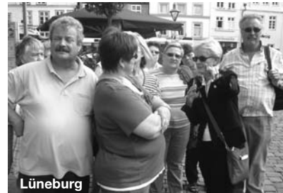
'ne nette Fremdenführerin bracht' uns her und wieder hin.