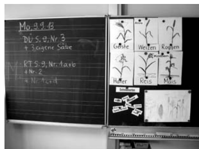
Verstellbare Klapptafeln erleichtern den Lehrkräften und den Schülern die Arbeit.