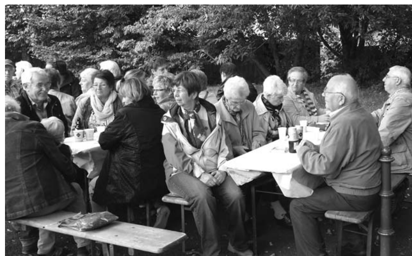
Schnapsschuss nach der Veranstaltung »Gölz wandert«: Geselligkeit, ein kleines Schwätzchen und ein gutes Gläschen, das lieben wir Gölzer... Für das leibliche Wohl hatte der Förderverein Kunstrasen im BSC Gölz gesorgt. Es gab heiße Würstchen und gekühlte Getränke.