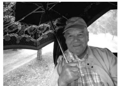
O Heideiland, du meine Wonne, der Häns fuhr Kutsch auch ohne Sonne.