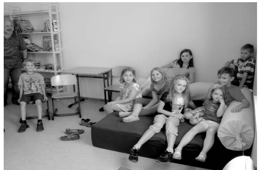
Ein beliebter Raum in der neuen Schule ist die Bibliothek. Hier können die kleinen »Nachwuchs-Gölser« Abstand nehmen vom anstrengenden Unterricht, können Lesen, ungestört Schwätzen oder einfach nur Ausruhen. Und die momentan noch leeren Bücherregale werden sicher bald gefüllt sein.

Ganztagsangebot ist erfreulich gut angefallen, denn immerhin wurden dazu spontan 39 Kinder angemeldet, und ich bin sicher, dass im nächsten Jahr noch eine größere Zahl dazukommen wird.