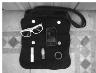
Verloren - gefunden