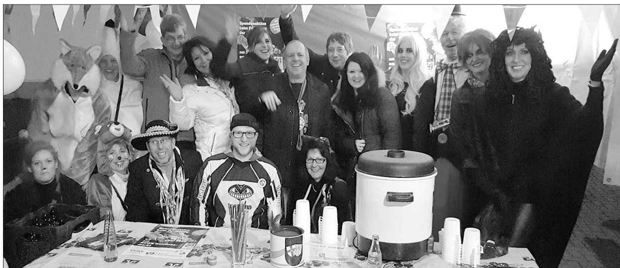
Die Teams der Volksbank Koblenz Mittelrhein eG und von REWE Scosceria danken allen Fassenachtsgecken, deren Spenden Kindern der Region auch nach Karneval noch Freude bringen.