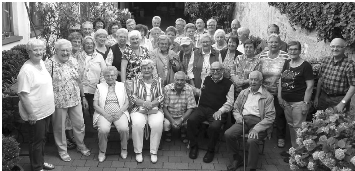
Die Reisegruppe der AWO Güls im blumengeschmückten Innenhof des Weingutes.