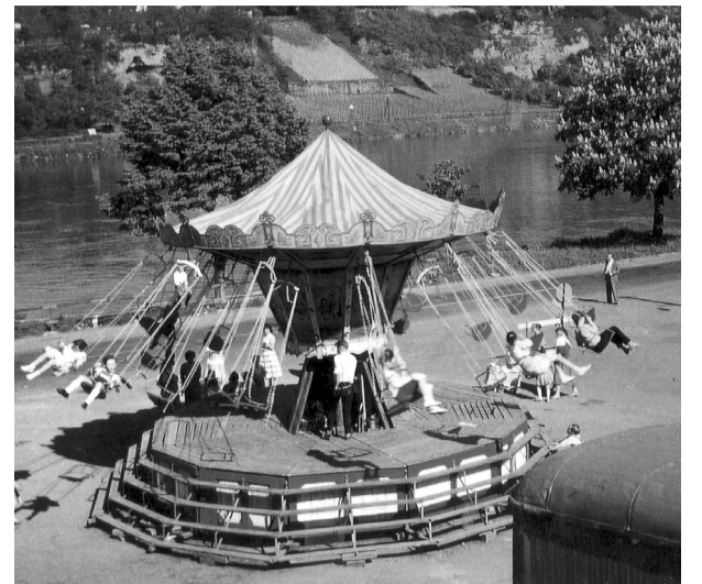
Ein seltener Anblick und sehr beliebt war ein Kettenkarussell auf der Gülser Kirmes. Die Stühchen an den Ketten schlangen weit über die Chaussee, fast über die Mosel.