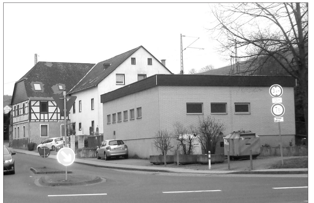
Der ehemalige Gülser Kirmesplatz musste einem Pumpwerk weichen. Nicht gerade einladend wirkte das Bauwerk am Haupteingang zu unserem Heimatort. Müllcontainer und parkende Autos konnten den Eindruck nicht verbessern. War der alte Kirmesplatz auch recht klein, so strahlte er doch eine gemütliche Atmosphäre aus. Zu den einfachen Fahrgeschäften kamen auf der gegenüberliegenden Straßenseite noch einige Buden. - Schön war die Zeit.