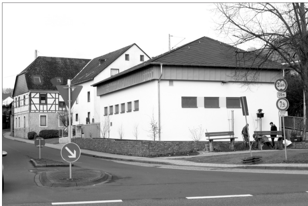
Nach knapp zweijähriger Umbauphase ist das Pumpwerk an der Mosel auf dem ehemaligen Kirmesplatz nun endlich fertig gestellt. Ein attraktives Walmdach ziert das Gebäude, das auch mit einem freundlichen Anstrich versehen wurde. Wo früher Autos parkten, entstand eine ansehnliche Gabionenmauer, hinter der Blumen und Koniferen Platz gefunden haben. Zwei Ruhebänke (werden gerade aufgestellt) vervollkommen nun das schicke Gülser Entree.