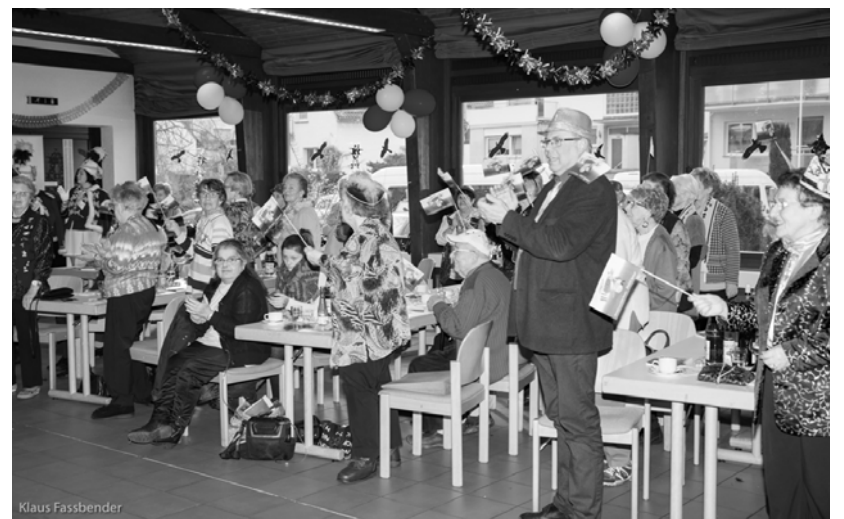
Gute Stimmung beim karnevalistischen Nachmittag in der Pfarrbegegnungsstätte. Das erhoffen sich die Verantwortlichen auch für dieses Jahr.

Die Gölser Husaren präsentieren am Sonntag, 10. Februar, ab 14.30 Uhr wieder Ausschnitte aus ihrem aktuellen Sitzungsprogramm in der Pfarrbegegnungsstätte. Alle Gölser Senioren sind herzlich eingeladen zu einem bunten Nachmittag